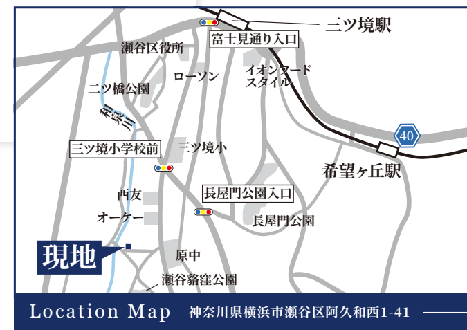
Location Map 神奈川県横浜市瀬谷区阿久和西1-41