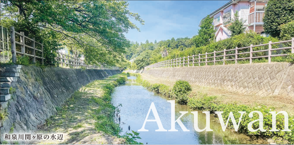
和泉川関ヶ原の水辺